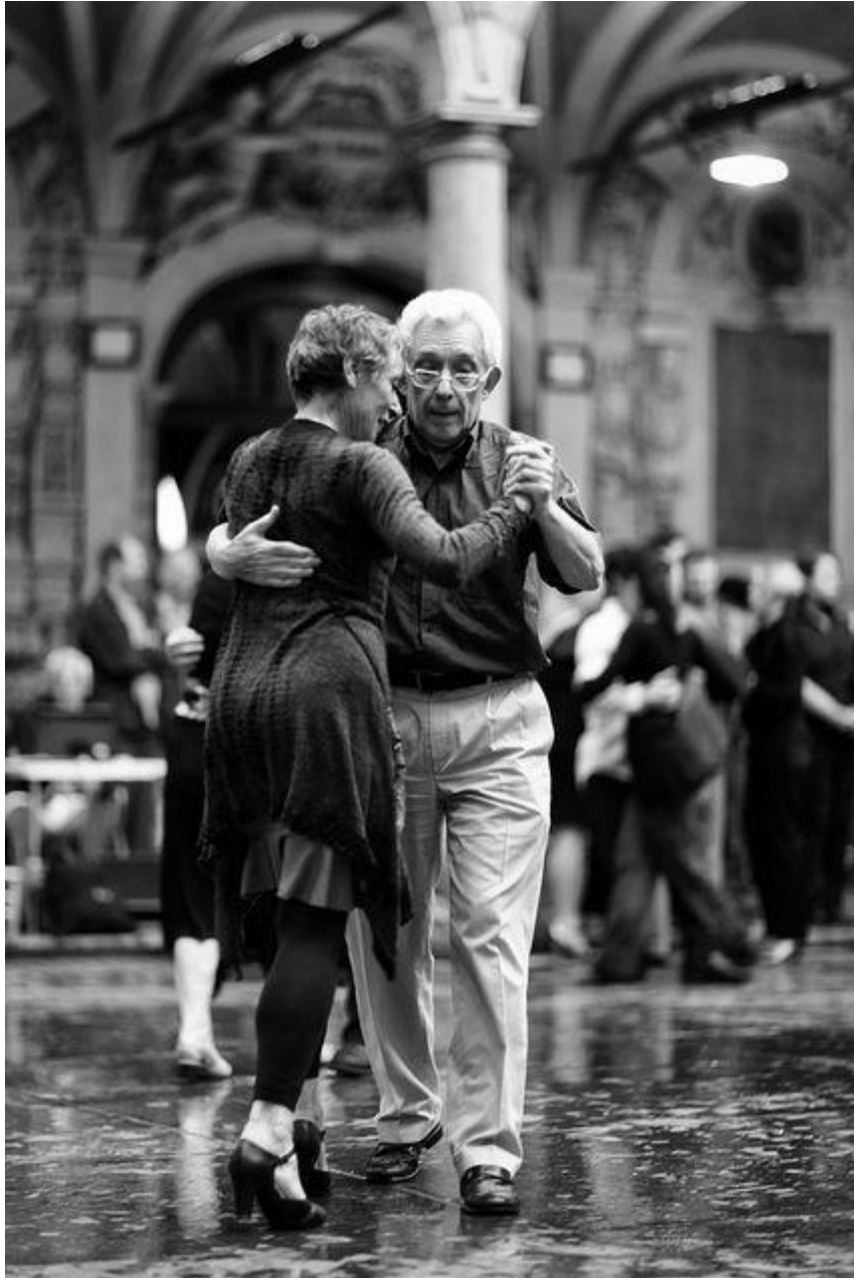
Il tango, affermava Enrique Santo Discepolo, è un pensiero triste che si balla.