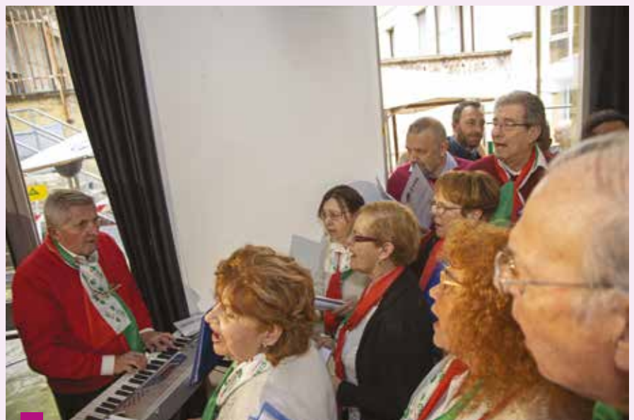
Il coro Al Lavoro ha accolto l'arcivescovo sulle note di “O mia bella madunina” e al termine dell'incontro ha cantato “Se otto ore vi sembra poche”, un classico del movimento operaio

Il compito del sindacato è vigilare sulle mura della città del lavoro, come sentinella che guarda e protegge chi è dentro la città, ma che guarda e protegge anche chi ne è fuori.