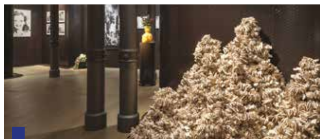
In questa foto un'opera alle Gallerie d'Italia. Nell'altra colonna una veduta dell'Università Statale

Le 43 opere in esposizione sono state selezionate da Fondazione Fiera - tra le 82 che compongono la sua collezione - per restituire uno spaccato della ricerca contemporanea internazionale attraverso il lavoro di artisti attivi dalla seconda metà del Novecento fino ai giorni nostri.