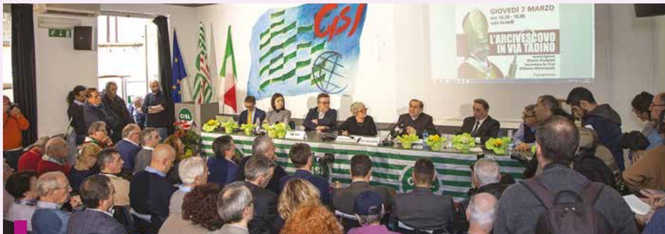
La sala Grandi affollata di dirigenti, delegati e operatori della Cisl milanese

125. Se cerchiamo di pensare quali siano le relazioni adeguate dell'essere umano con il mondo che lo circonda, emerge la necessità di una corretta concezione del lavoro, perché, se parliamo della relazione dell'essere umano con le cose, si pone l'interrogativo circa il senso e la finalità dell'azione umana sulla realtà. Non parliamo solo del lavoro manuale o del lavoro della terra, bensì di qualsiasi attività che implichi qualche trasformazione dell'esistente, dall'elaborazione di un studio sociale fino al progetto di uno sviluppo tecnologico. Qualsiasi forma di lavoro presuppone un'idea sulla relazione che l'essere umano può o deve stabilire con l'altro da sé. La spiritualità cristiana, insieme con lo stupore contemplativo per le creature che trovia-