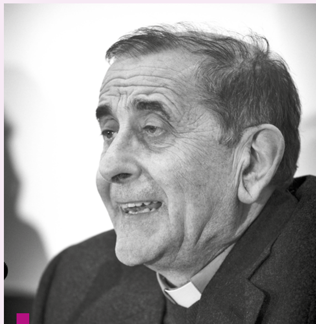
Monsignor Mario Delpini

camente plasmata dalle situazioni, rappresentano un patrimonio al quale attingere. In questa tradizione l'esperienza formativa ha occupato un posto significativo. L'attenzione alla formazione è una sfida che ha tratti inediti in questo tempo di innovazione così rapida e affascinante, di globalizzazione così tumultuosa e di fragilità morale e personale così diffusa. La formazione non può essere solo una rincorsa alle novità prodotte dalla tecnologia e dai processi produttivi, ma anche una forma di sostegno alle persone, alle fragilità emotive, alle vicende familiari e sanitarie, fisiche e psicologiche.