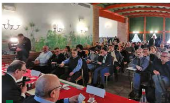
I partecipanti al Consiglio generale che si è tenuto al Grand Hotel Doria il 20 marzo scorso a Milano

sulla riqualificazione: "Dobbiamo impegnarci a riqualificare le persone rispetto all'utilizzo delle tecnologie perché è questo l'effetto sociale dell'innovazione. La vendita attraverso internet e i call center, sono sintomo dei tempi che cambiano. Però già oggi grandi aziende come BMW e Accenture stanno assumendo persone che hanno capacità e stanno licenziando altre considerate obsolete."