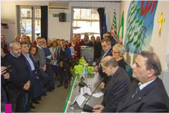
La benedizione dell'arcivescovo al termine dell'incontro

umano può volgersi contro sé stesso. La riduzione dei posti di lavoro «ha anche un impatto negativo sul piano economico, attraverso la progressiva erosione del “capitale sociale”, ossia di quell'insieme di relazioni di fiducia, di affidabilità, di rispetto delle regole, indispensabili ad ogni convivenza civile».[104] In definitiva «i costi umani sono sempre anche costi economici e le disfunzioni economiche comportano sempre anche costi umani».[105] Rinunciare ad investire sulle persone per ottenere un maggior profitto immediato è un pessimo affare per la società.