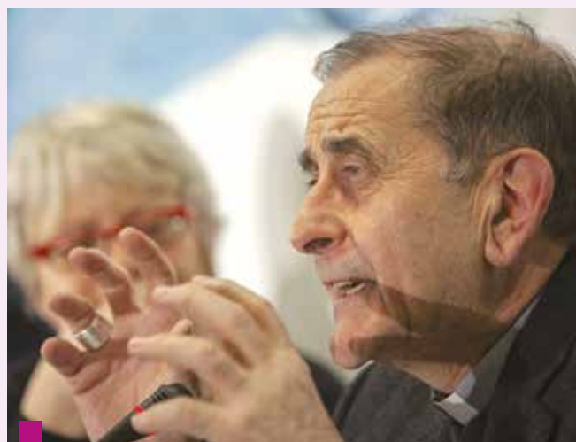
Monsignor Delpini durante il suo intervento

Fare sindacato di prossimità è la nostra missione e ci porta ad intervenire su diversi ambiti: contrattare le condizioni di lavoro nelle aziende; tutelare le persone, sia a livello collettivo che individuale; negoziare sui temi dello sviluppo economico e sociale con le istituzioni.