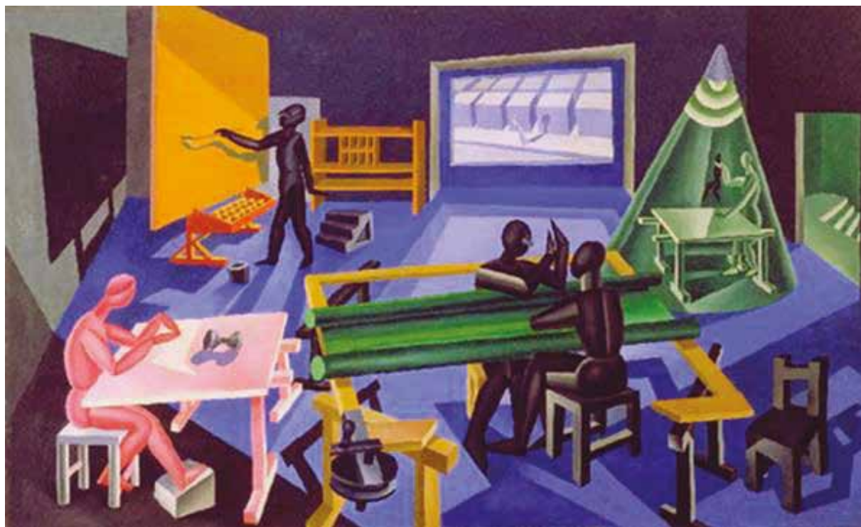
Fortunato Depero, "La casa del mago" 1920

SCADENZA CONSEGNA ELABORATI 30 APRILE 2019