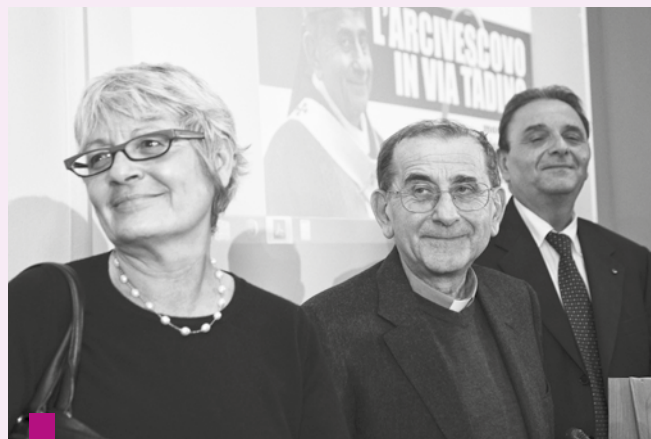
Annamaria Furlan, monsignor Mario Delpini e Carlo Gerla

127. Affermiamo che «l'uomo è l'autore, il centro e il fine di tutta la vita economico-sociale». [100] Ciononostante, quando nell'essere umano si perde la capacità di contemplare e di rispettare, si creano le condizioni perché il senso del lavoro venga stravolto.[101] Conviene ricordare sempre che l'essere umano è nello stesso tempo «capace di divenire lui stesso attore responsabile del suo miglioramento materiale, del suo progresso morale, dello svolgimento pieno del suo destino spirituale». [102] Il lavoro dovrebbe essere l'ambito di questo multiforme sviluppo personale, dove si mettono in gioco molte dimensioni della vita: la creatività, la proiezione nel futuro, lo sviluppo delle capacità, l'esercizio dei valori, la comunicazione con gli altri, un atteggiamento di adorazione. Perciò la realtà sociale del mondo di oggi, al di là degli interessi limitati delle imprese e di una discutibile razionalità economica, esige che «si continui a perseguire quale priorità l'obiettivo dell'accesso al lavoro [...] per tutti».[103]