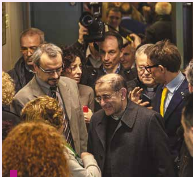
L'ingresso di monsignor Mario Delpini in via Tadino

1.1. La gratitudine per una tradizione che è evoluta ed è rimasta feconda: un "giacimento di intelligenza collettiva" (A. Furlan). I principi di autonomia, associazione, contrattazione, nella loro attuazione stori-